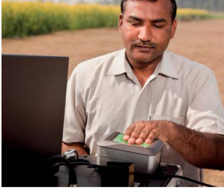
عملية تسجيل جماعية بالهند