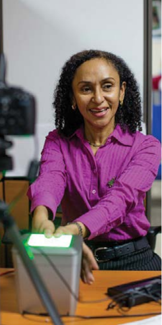
الحصول على بصمة الإصبع لاستخراج جواز سفر في بنما