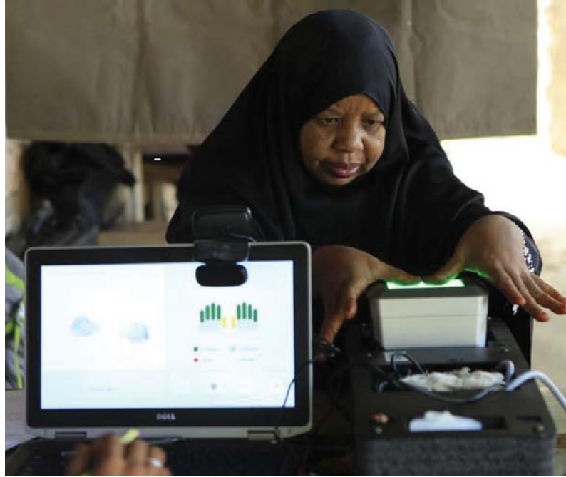
الحصول على بصمة الإصبع أثناء تسجيل بيانات الناخب في كينيا